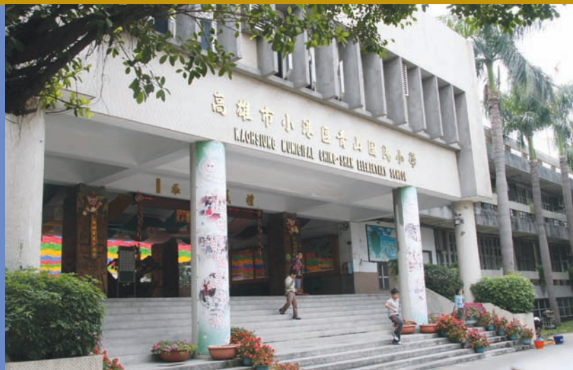
* 青山國小校門大樓穿堂柱子充滿藝術巧思。

「青山」是學生數584人的小校，校舍的外觀並不起眼，但是一旦踏入校門，就可以感受到典雅藝術氣息迎面而來，首先映入眼簾的是一排排放整齊的各式奇岩怪石，大樓穿堂柱子則以不同規則的木料拚黏出頗有原住民風味的圖騰，四柱環繞各具巧思與美感，且走進教室、走廊、樓梯間、草坪、教室棟距間、地